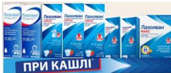
Основна викладка Лазолван (70 см)**