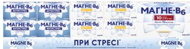
Основна викладка Магне-В6 (70 см)*