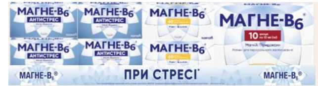
Основна викладка Магне-В6 (50 см)*