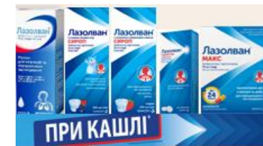
Основна викладка Лазолван (50 см)**